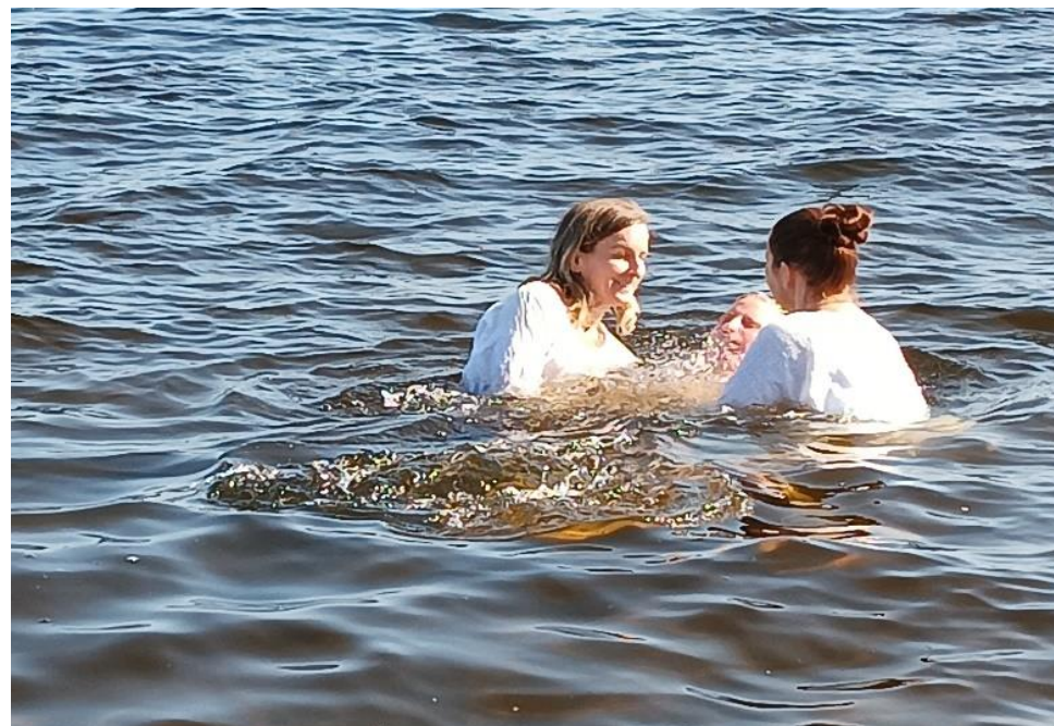
Vi gleder oss over at mennesker i nabolag vinnes for Jesus og lar seg døpe.

7 Kjærligheten utholder alt, tror alt, håper alt, tåler alt.